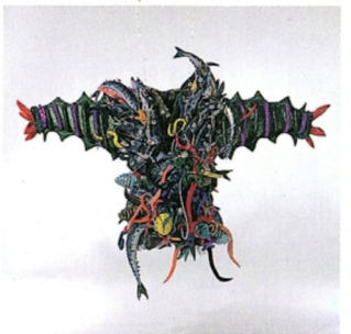
〔株〕応用工学研究所 ● ☎03-3595-3588

たり、ジャケットの形をした着られるオブジェ写真を発表したりと、またひと味違う作品が楽しめた。