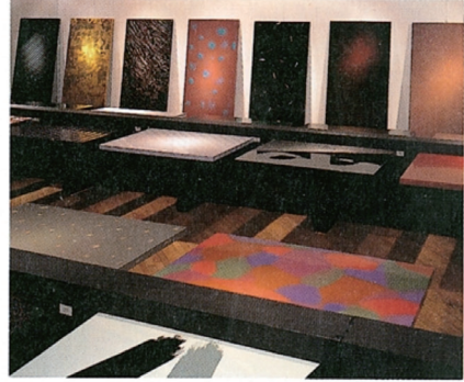
〔株〕サーフェス ● 〒933 富山県高岡市二塚322-5 高岡テクノドーム ☎0766-21-8181

国や県が補助し指導する事業は数あるが、補助期間が終っても、それが事業として定着することは滅多にないという。ところが国と富山県が推進した「事業転換補助事業」をきっかけに新会社がひとつ誕生した。〔株〕サーフェスである。同社はテキスタイルデザイナーの粟辻博さんを相談役に招き、「形」にこるのではなく、表面を「塗り」で彩るために技術提供をする。設立は昨年3月（47号64頁）。このサーフェスの作品展が開かれた（12月11日〜12日・東京六本木アークシスギャラリー）。一年前にも同様の展不会を開いている。その時は「補助期間」最後の成果発表だったが、今回は企業として出発した第一歩の展で、60数枚の塗りを施した板が展示された。今までにない色の美しいものもあり、目をひいた。